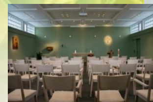
Raum der Stille