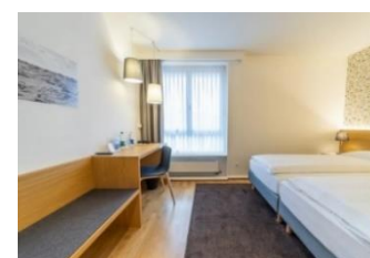
Einzelzimmer mit gratis W-Lan, 30 TV, Haarfön, allergikerfreundlich, Festnetz-Telefon (CH gratis), Dusche&WC, Schreibtisch